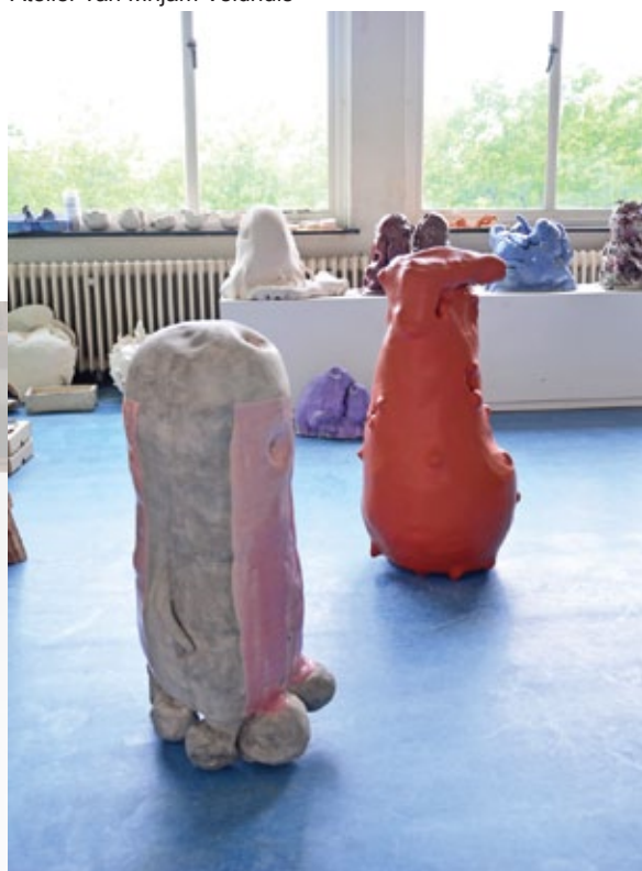
Nieuwe werk in haar atelier