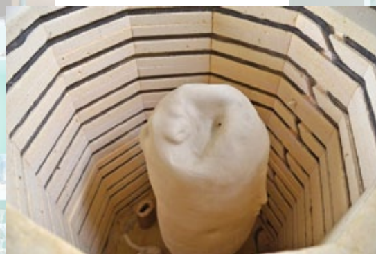
Het werk in de oven

Website Mirjam Veldhuis: www.mirjamveldhuis.nl