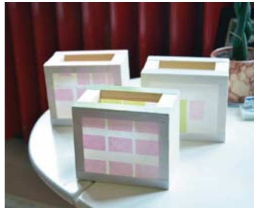
"Mino Lightboxes", 2014 Yana Poppe / Mino washi en hout

Wanneer ik aan het schilderen ben voelt het alsof ik aan het ontleden ben, of, juist aan het bouwen ben zoals een architect. Ik wil inzicht krijgen in verhoudingen, ruimte en misschien wel ontdekken waar precies de esthetiek zit. Met behulp van kleur probeer ik een overzicht te krijgen van de kenmerken van de architectuur. Wel ben ik me tijdens dit proces bewust van hoe bepaalde kleuren op elkaar reageren en beïnvloed ik ook het uiteindelijke beeld.