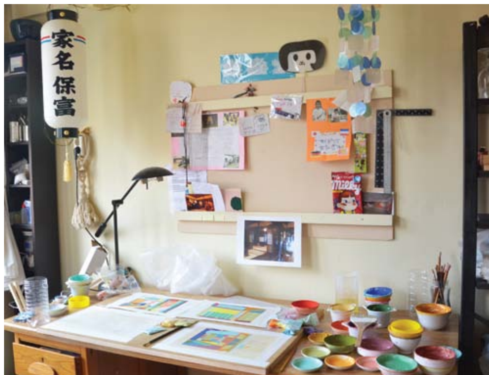
Een deel van het atelier van Yana Poppe